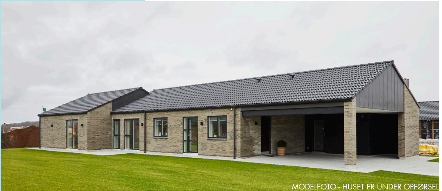
MODELFOTO - HUSET ER UNDER OPFØRSEL