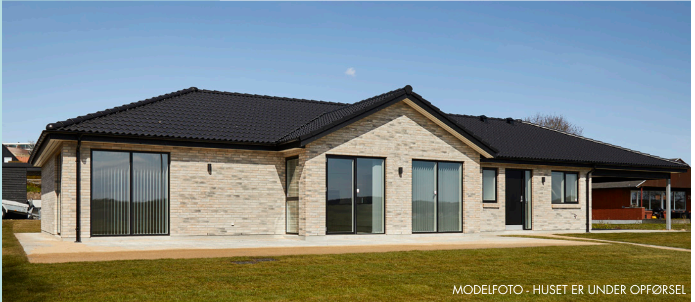
MODELFOTO - HUSET ER UNDER OPFØRSEL