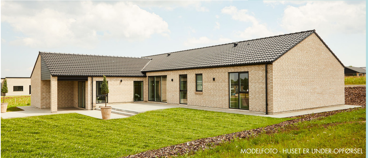
MODELFOTO - HUSET ER UNDER OPFØRSEL