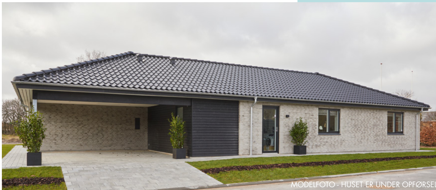
MODELFOTO - HUSET ER UNDER OPFØRELSE