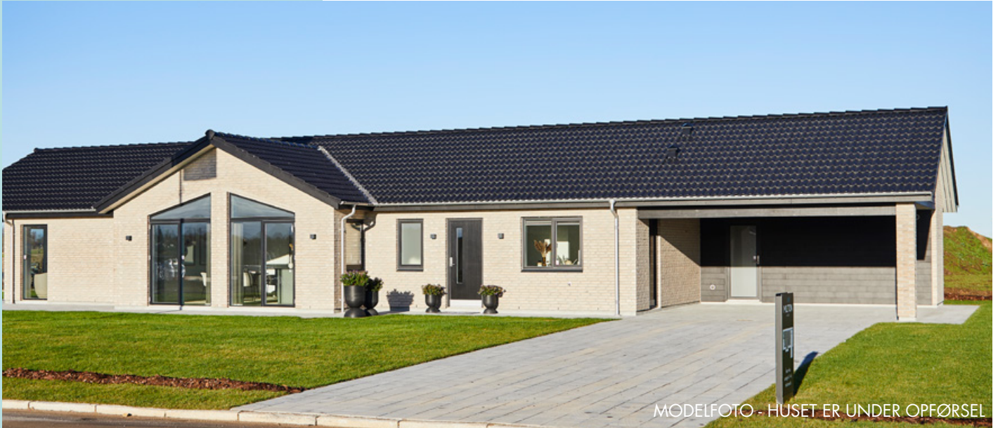
MODELFOTO - HUSET ER UNDER OPFØRSEL