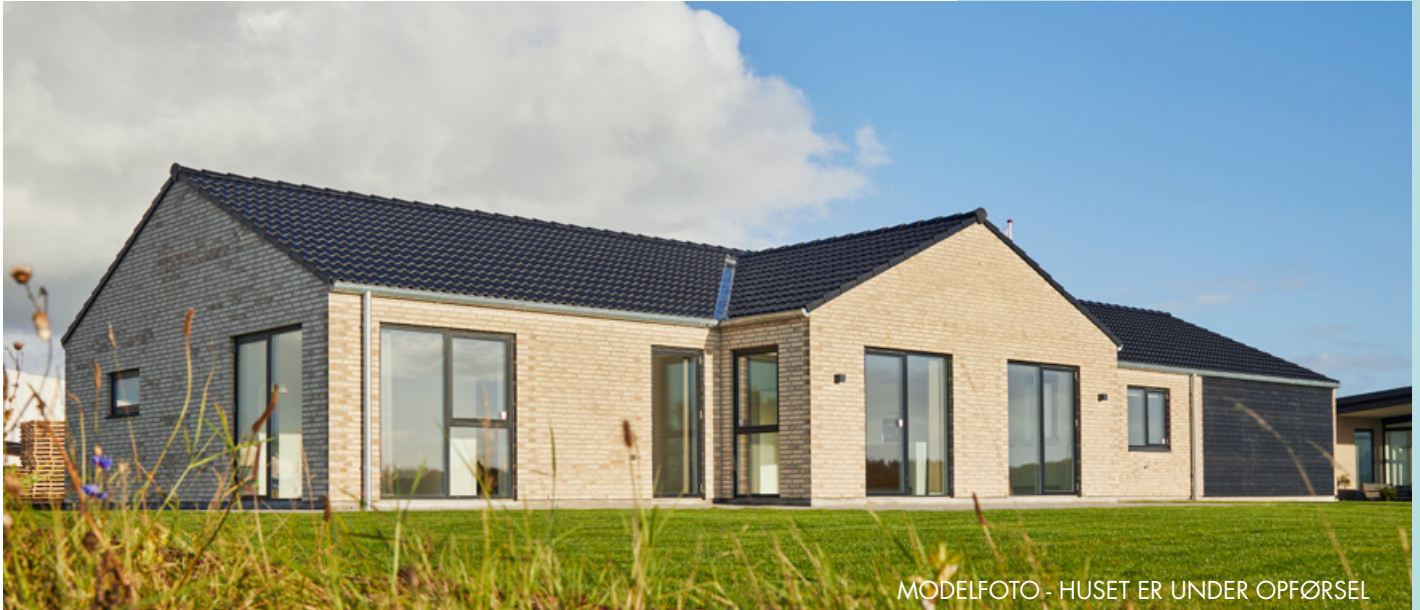
MODELFOTO - HUSET ER UNDER OPFØRSEL

Salgspris, incl. grund 3.750.000,- Betal først ved overtagelse