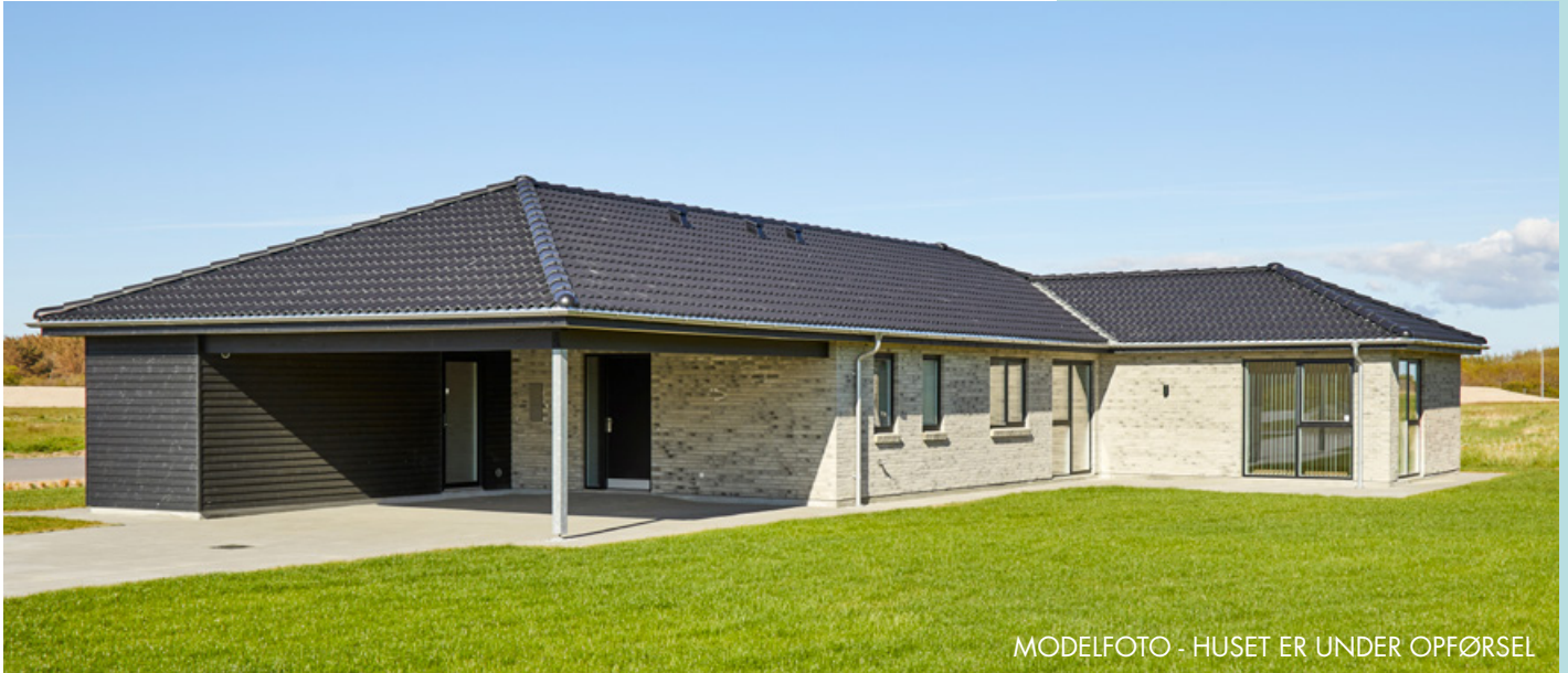
MODELFOTO - HUSET ER UNDER OPFØRSEL