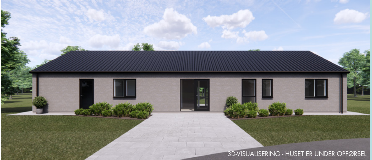
3D-VISUALISERING - HUSET ER UNDER OPFØRSEL

Salgspris inkl. grund 4.495.000,- Betal først ved overtagelse