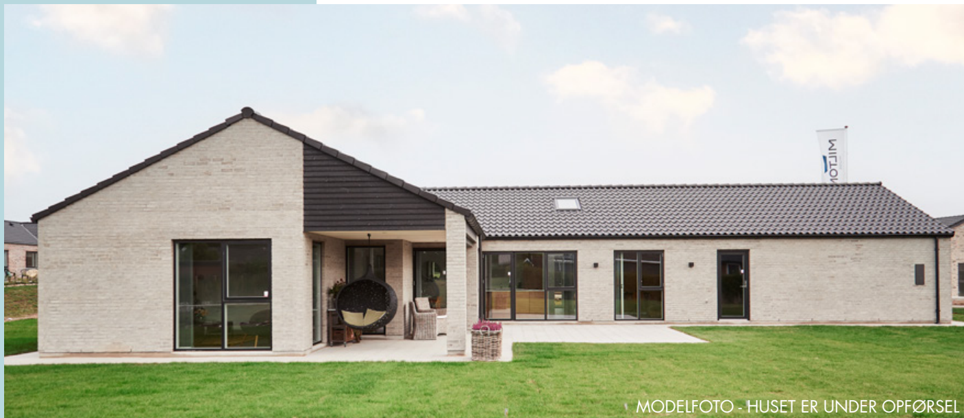
MODELFOTO - HUSET ER UNDER OPFØREL