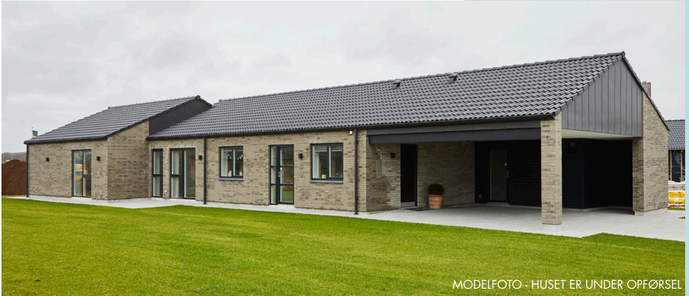
MODELFOTO - HUSET ER UNDER OPFØRSEL

Salgspris, incl. grund 3.495.000,- Betal først ved overtagelse