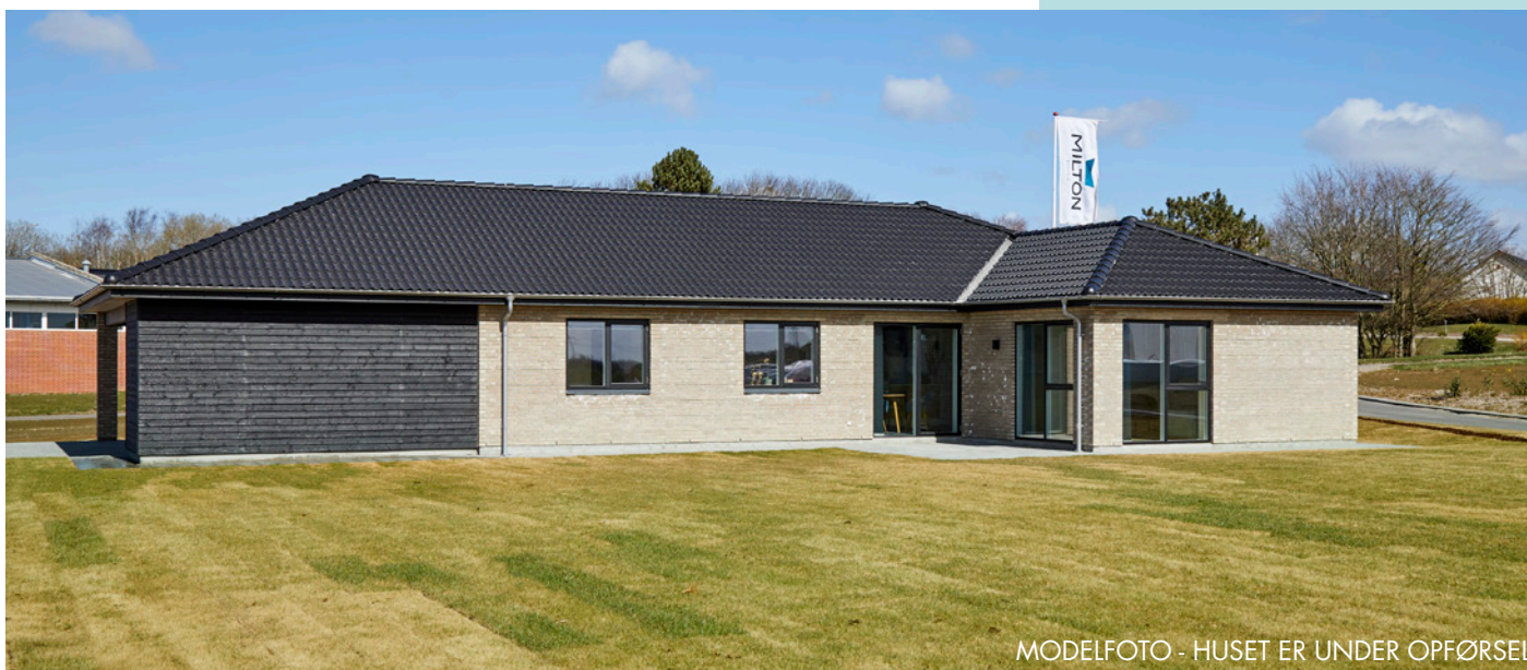
MODELFOTO - HUSET ER UNDER OPFØRSEL