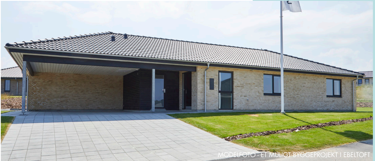
MODELFOTO - ET MÜLIGT BYGGEPROJEKT I EBELTOFT